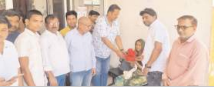
मरीजों को फल वितरित करते भाजपा कार्यकर्ता