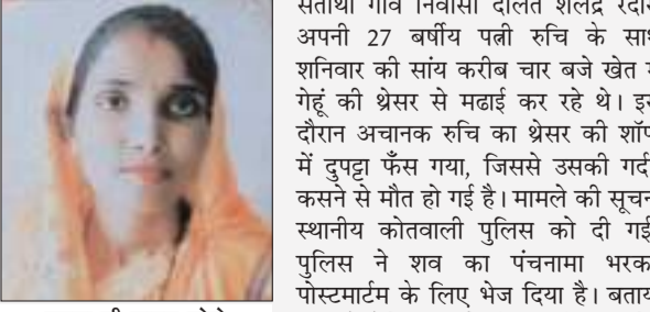
मृतका की फाइल फोटो