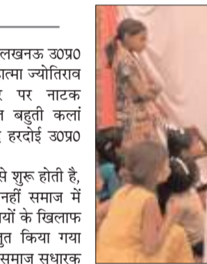
फोटो: राष्ट्रीय प्रस्तावना

हरदोई। संस्कृति विभाग जवाहर भवन लखनऊ 30प्र0 सरकार के सहयोग से शनिवार को महात्मा ज्योतिराव फूले जी की जयंती के अवसर पर नाटक 'सत्यशोधक' का मंचन ग्राम पंचायत बहुती कला ब्लॉक भवन तहसील संडौला जनपद हरदोई 30प्र0 में कराया गया।