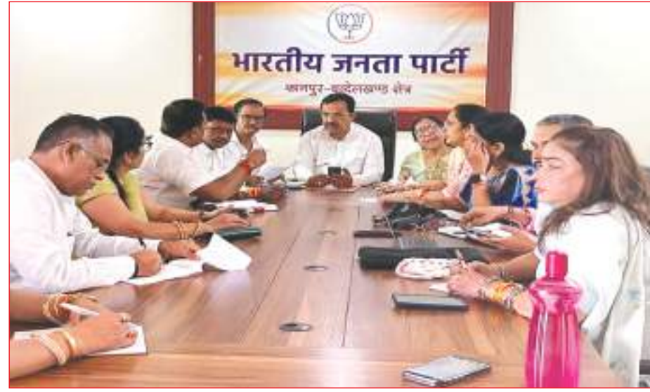
राष्ट्रीय प्रस्तावना न्यूज नेटवर्क

कानपुर। नारी शक्ति वंदन अधिनियम को जन-जन तक पहुंचाने के लिए भाजपा 12 अप्रैल से विशेष अभियान शुरू करने जा रही है। इस अभियान के तहत व्यापक जनसंपर्क कर महिलाओं की भागीदारी सुनिश्चित की जाएगी। क्षेत्र के सभी जिलों, लोकसभा और विधानसभा क्षेत्रों में कार्यक्रम आयोजित कर अधिनियम की जानकारी दी जाएगी। पार्टी कार्यकर्ताओं को घर-घर संपर्क कर जागरूकता फैलाने की जिम्मेदारी सौंपी गई है। नारी शक्ति वंदन अधिनियम के माध्यम से महिलाओं को सशक्त बनाने का लक्ष्य लेकर यह