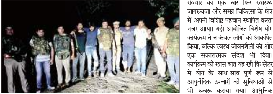
राष्ट्रीय प्रस्तावना न्यूज नेटवर्क