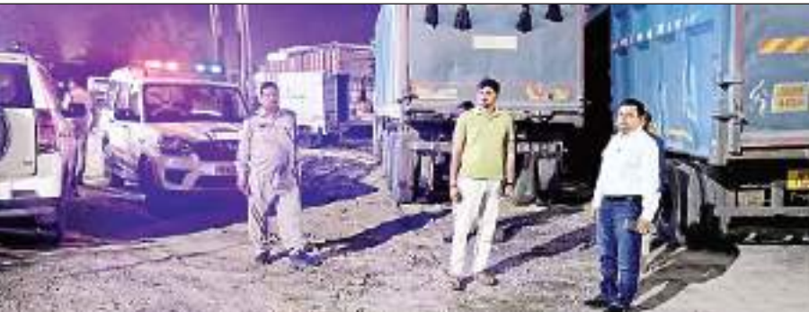
राष्ट्रीय प्रस्तावना न्यूज नेटवर्क