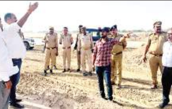
राष्ट्रीय प्रस्तावना न्यूज नेटवर्क

कौशांबी। जनपद में अवैध खनन की प्राप्त शिकायतों के क्रम में जिलाधिकारी द्वारा गठित संयुक्त जांच समिति ने तहसील मंडानपुर क्षेत्र अंतर्गत महेवा घाट, महिला घाट