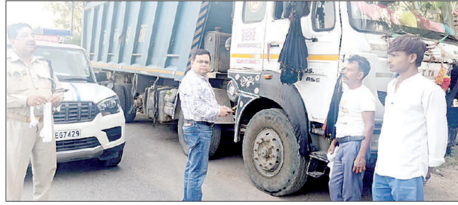
राष्ट्रीय प्रस्तावना न्यूज नेटवर्क